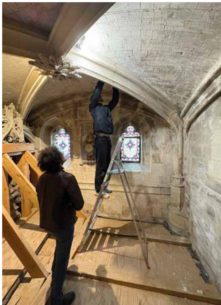
Relevés en cours par le bureau structurel décembre 2025