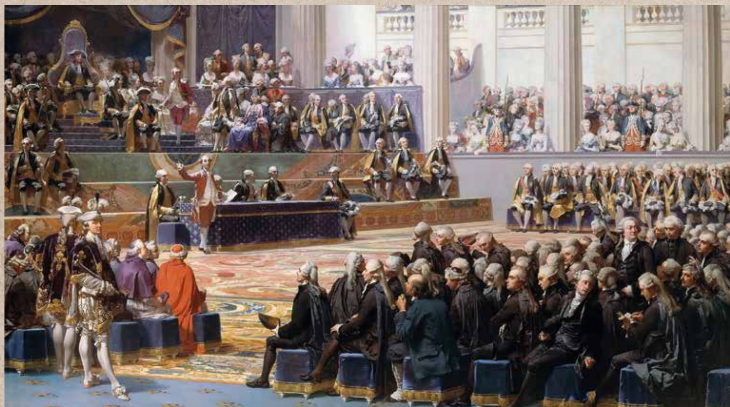
Ouverture des Etats Généraux à Versailles le 5 mai 1789 - Louis Charles Auguste COUDER (1839). Musée de Versailles.