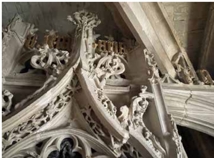
Une partie des désordres sur le dais en pierre

C'est pourquoi, pour déterminer l'origine des désordres de l'architecture, des études complémentaires ont été menées au second semestre 2025, avec la validation de la Conservation Régionale des Monuments Historiques. Les résultats de cette étude montreront l'impact des poussées des voûtes sur les maçonneries et ainsi définir les mesures adaptées à mettre en place pour la restauration de l'ensemble du contenant (chapelle du saint-Sépulcre) et du contenu (mise au tombeau).