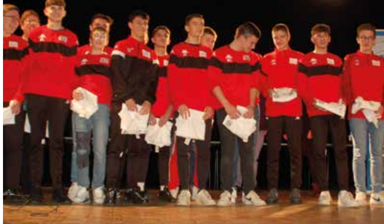
Les U15 de l'EU Football Club ont été récompensés pour leur accession en championnat régional.