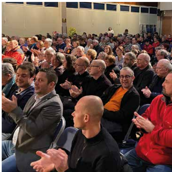
La salle Michel Audiard était pleine le 27 janvier dernier.