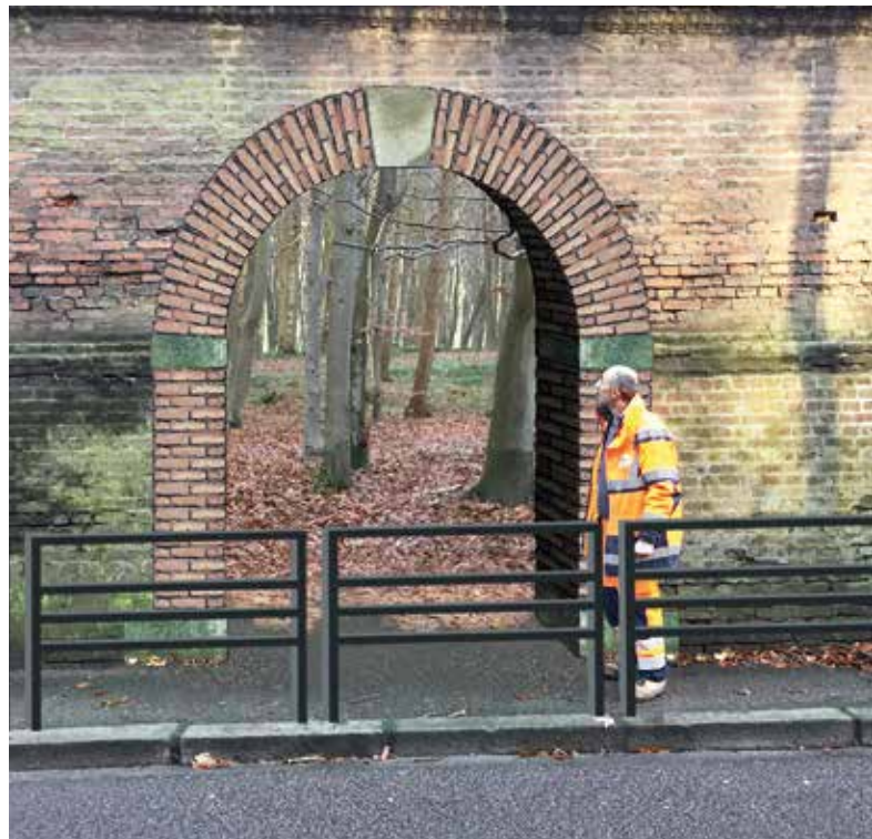
Simulation d'une porte dans l'enceinte du parc du Château d'Eu. Infographie L. Cholet.

En conséquence, le quartier Sainte-Croix souffre d'une forme d'enclavement, en raison notamment du caractère anxiogène que sa liaison au centre-bourg oppose aux usagers les plus vulnérables. Pour autant, faute d'itinéraires alternatifs, des piétons empruntent quotidiennement ce chemin : déplacements utilitaires pour l'essentiel (travail, courses), auxquels s'ajoutent des déplacements de loisirs en saison (liaison ville-haute vers le littoral). C'est pourquoi, dans le cadre de son Plan d'Actions pour les Mobilités Actives, la municipalité souhaite contribuer à sécuriser ce cheminement, en permettant d'accéder directement au parc du Château, à l'extrémité sud-ouest de la propriété communale.