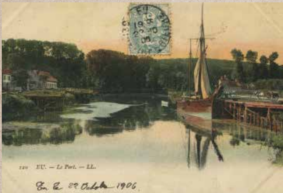
Le port d'Eu au tout début du 20 e siècle.

Quant au cheval et à la voiture, ils restaient enlisés dans la vase. Alerté, le service du port fit baisser les eaux du canal afin de mettre à découvert le cheval et son véhicule. Tout l'après-midi, une équipe d'ouvriers de la scierie de M. Magnier parvint à dégager le cadavre du cheval qui fut emmené dans l'établissement d'équarrissage de M. Maumené rue de l'Isle. La voiture ne fut remontée que le lendemain.